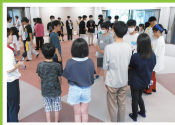
チームビルディング